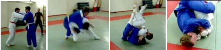
Video 1 - Video 2 - Video 3 - Video 4 - Video 5 = Achtung Videos sind 4-10 MB !!